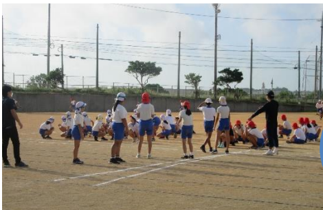
6年生 学級対抗リレー

9月まで、新型コロナウイルス感染予防対策もあり学校行事や授業参観等、保護者等が校舎内に入ることを制限しておりました。いろいろ不安な面もあったかと思いますがご理解・ご協力ありがとうございました。10月頃から、制限がある中でも3密に配慮しながら行事を実施しております。まだ完全とはいきませんが子ども達の応援と学校へのご協力を宜しくお願いします。