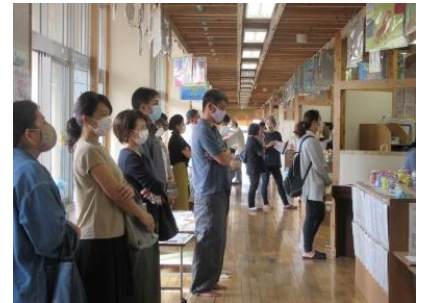
3. 4年生の頑張りを廊下から参観しているお父さん・お母さん