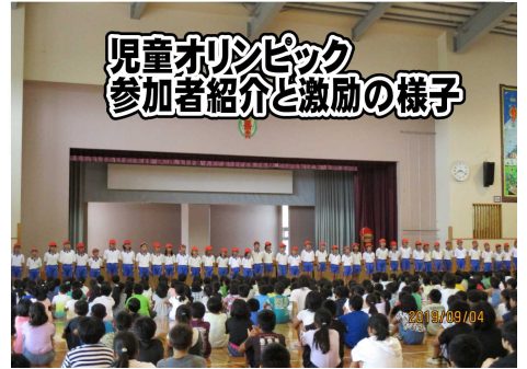
児童オリンピック参加者紹介と激励の様子

家庭でも、子ども達の生活リズムが戻るまで大変だったと思います。早寝・早起き・朝ご飯・てくてく登校推進で生活習慣のリズムを整え、有意義な1学期後半になるようご協力を宜しくお願い致します。