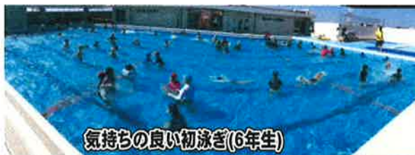
気持ちの良い初泳ぎ(6年生)