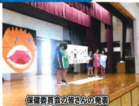
保健委員会の皆さんの発表